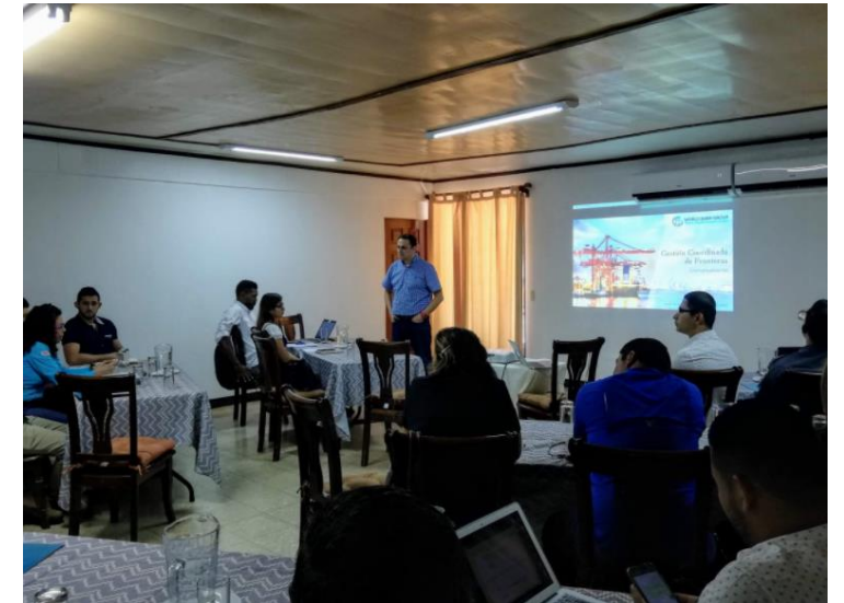
PUERTO LIMÓN (PUERTO MARÍTIMO)