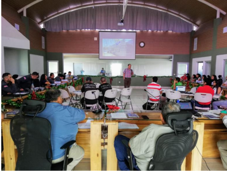
PEÑAS BLANCAS (PUERTO FRONTERIZO TERRESTRE)