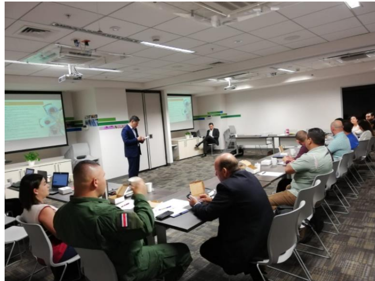
GRAN ÁREA METROPOLITANA (AEROPUERTO)